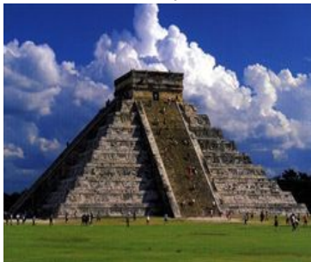
Una piramide Maya. E' rimasta in piedi.

Anche oggi non se ne fa niente: nessuna fine del mondo. La cosa curiosa è come abbia fatto il mondo a interessarsi di una vicenda simile, da confinare a qualche studioso di esoterismo. E invece è diventata una notizia di portata mondiale. Si potrebbe dire che ogni cosa è buona per fuggire dai problemi, soprattutto in tempi come questi. Tra l'altro i Maya ci avevano già provato a preconizzare la fine del mondo, visto che da alcuni studiosi era stata prospettata non oggi, ma il 5 giugno 2012. Non successe niente. E anche oggi...un altro rinvio.